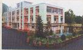
नव-निर्मित महाप्रबंधक/निर्माण कार्यालय भवन।

स्वतंत्रता दिवस के अवसर पर सभी को संगठन की ओर से हार्दिक शुभकामनाएँ दी। उन्होंने अपने वक्तव्य में निर्माण संगठन द्वारा चल रही विभिन्न परियोजनाओं, पूरी की गई परियोजनाओं तथा अन्य उपलब्धियों से सभी को अवगत कराया। अपने वक्तव्य के पश्चात उन्होंने नव-निर्मित महाप्रबंधक/निर्माण कार्यालय भवन का उद्घाटन किया तथा इस मौके पर उन्होंने महाप्रबंधक/निर्माण संगठन द्वारा प्रकाशित किए गए नई टेलीफोन नंबरों की भी विमोचन किया। उन्होंने केंद्रीय चिकित्सालय,