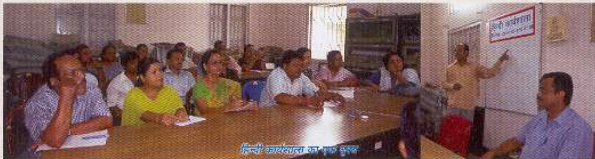
हिन्दी कार्यशाला का एक दृश्य

महाप्रबंधक/निर्माण संगठन के राजभाषा अनुभाग में दिनांक 29.07.08 तथा 30.07.2008 को विभिन्न कार्यालयों में कार्यरत कर्मचारियों के लाभार्थ दो दिवसीय हिन्दी कार्यशाला का आयोजन किया गया। उक्त कार्यशाला में विभिन्न अनुभागों के कर्मचारियों ने भाग लिया।