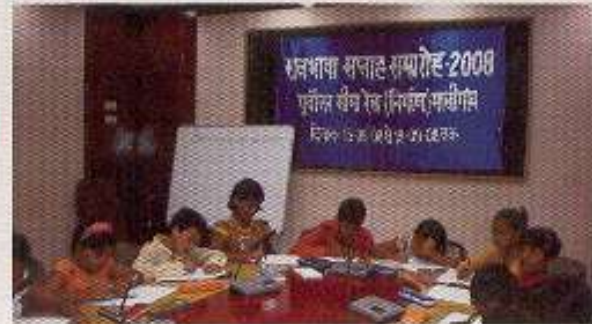
राजभाषा सप्ताह के दौरान बच्चों के लिए आयोजित चित्रांकन प्रतियोगिता।